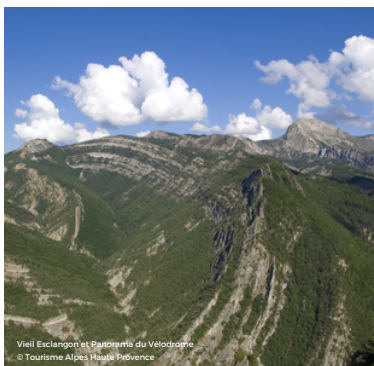
Vieil Esclangon et Panorama du Vélodrome